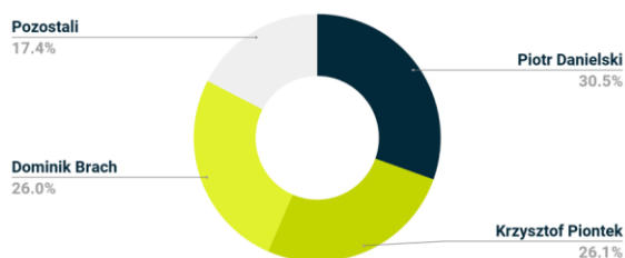
Struktura akcjonariatu / udział w kapitale